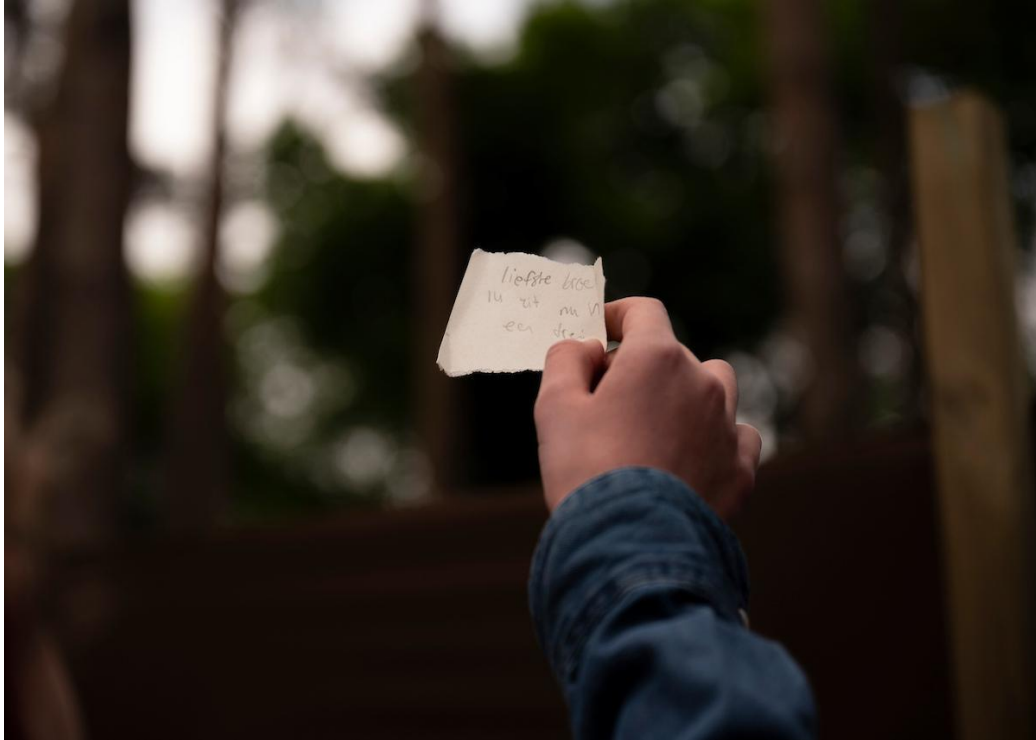
Scene uit 'Onbestemd' van Theater na de Dam - Bram Petraeus