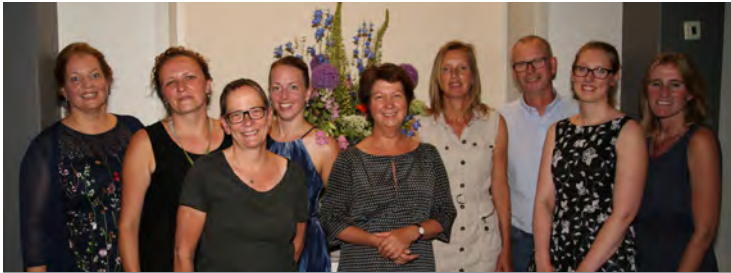
Jaarlijks organiseren Hospice Kajan en Tergooi een symposium over het belang van palliatieve zorg

Onze specialisatie in palliatieve hospicezorg maakt Hospice Kajan tot een aantrekkelijke partner op het gebied van innovatie en onderzoek. Hier dragen we graag aan bij. Zo heeft Kajan een actieve rol in het project 'Pallisupport'. Hierin ontwikkelden we een regionaal zorgpad waarin staat wat in de palliatieve zorg wanneer en door wie wordt gedaan. Dit deden we samen met onze netwerkpartners en in afstemming met het Consortium Palliatieve Zorg Noord-Holland en Flevoland.